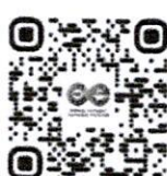
สมัครเรียน