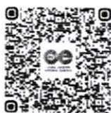
คู่มือการเข้าใช้งาน