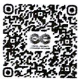
วิดีโอแนะนำ MUCE